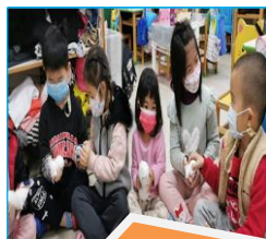
幼：布球的重量，縫的方法，形狀都會影響