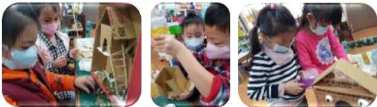
孩子們一起合作動手創作!過程中,不斷的討論並嘗試解決問題。

孩子們一同合作利用教室學習區的各種素材，動手創作出各式鳥屋。孩子們從一次次的修正調整與解決問題中(剪裁問題:紙板有點硬→可以請力量大的人幫忙剪裁切割;黏貼問題:白膠好久才會乾→改用保麗龍膠固定比較快;固定問題→鳥屋放在窗台容易倒→要用繩子(或鐵絲)綁好才不會倒)而後,每當孩子們發現鳥兒在他們創作的鳥屋駐足停留,便能讓孩子們開心分享許久!