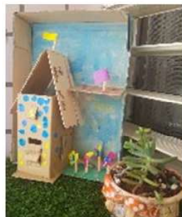
各式鳥屋的設計,包含著孩子們對於小暖的溫暖關懷和滿滿的愛!