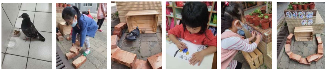
風塵僕僕歸來的糖糖，在孩子們精心布置的空間裡自由的來去。