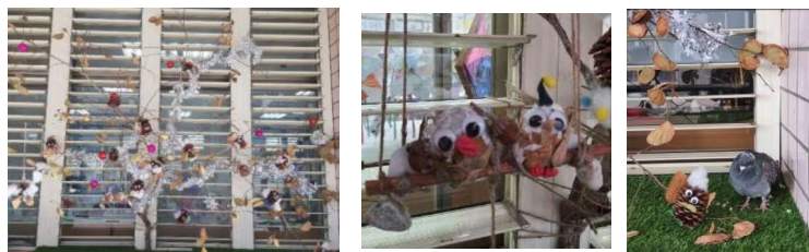
閃亮的小鳥派對創作，除了是糖糖休息打盹的好地方，也吸引了校園中鳥兒們前來駐足。

孩子們討論合作擬定出「如何和糖糖當朋友」的說明與約定，『用眼睛看!』、『不能用手摸!』、『不能大聲說話!』願能打造一個友善與尊重生命的空間。