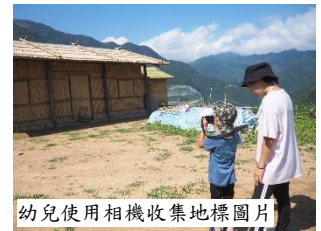
幼兒使用相機收集地標圖片