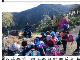
戶外教育-孩子們訪問部落耆老