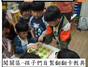
闖關區-孩子們自製翻翻卡教具