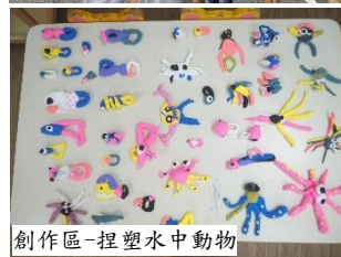
創作區-捏塑水中動物