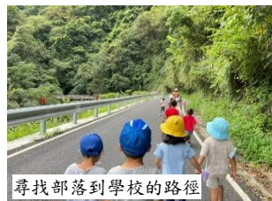
尋找部落到學校的路徑