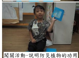
闖關活動-說明防災植物的功用