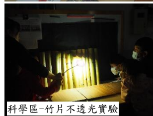
科學區-竹片不透光實驗