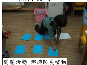
闖關活動-辨識防災植物