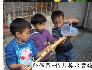
科學區-竹片接水實驗