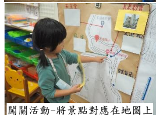
闖關活動-將景點對應在地圖上