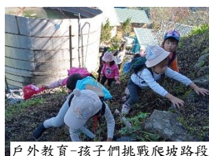
戶外教育-孩子們挑戰爬坡路段