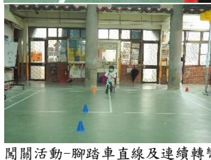
闖關活動-腳踏車直線及連續轉彎