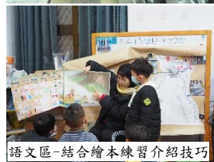
語文區-結合繪本練習介紹技巧