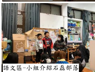
語文區-小組介紹石磊部落