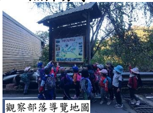
觀察部落導覽地圖