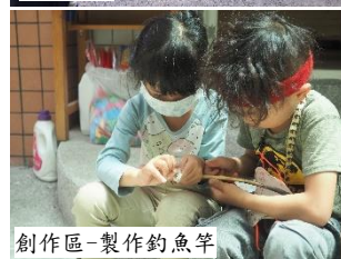
創作區-製作釣魚竿