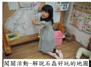
闖關活動-解說石磊好玩的地圖