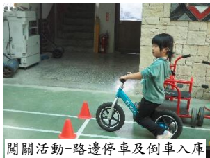
闖關活動-路邊停車及倒車入庫