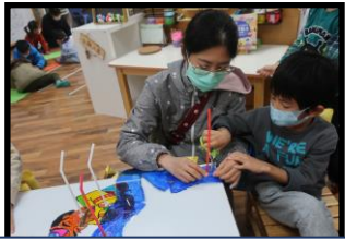
家長一同參與課程

透過每次的分享與討論都能激發出不一樣的想法與內容，在欣賞與觀察戲偶後，也對角色的特徵與個性有了更進一步的瞭解。在製作戲偶的過程中，孩子們加入了自己想要的元素。在角色的安排及職掌的分工上，也體會到團體互助合作的重要性。唯有親身經歷演戲的過程，才能逐步認識與瞭解，對孩子來說會更有意義！老師的角色即是陪伴與引導，看見他們在遇到問題時，能運用不同的方式嘗試解決。無論是查詢資料、同儕間對話、與家人和老師探討等…那些自信發光、炯炯有神的神情，真的很令人感動！