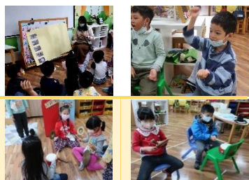
孩子討論著 搭配場景的節奏

欣：「布袋戲中有敲打鑼鼓的聲音。」嘉：「會因為劇情的不同，敲打的節奏和氣氛也不一樣。」師：「後場音樂，我們可以怎麼做呢？」翔：「之前有操作過的樂器，可以拿來試試看。」好：「但是我們不知道節奏，怎麼辦？」嘉：「問看看爸爸媽媽、上網找資料，回來後再一起討論。」孩子們提到布袋戲的音樂，有一股輕快的感覺，加入配樂後，會有讓人充滿活力！在孩子們體驗配樂的感覺，並上網查詢戲劇上適合演奏的節奏。搭配劇情中的場景！讓我們的布袋戲劇更顯生動！