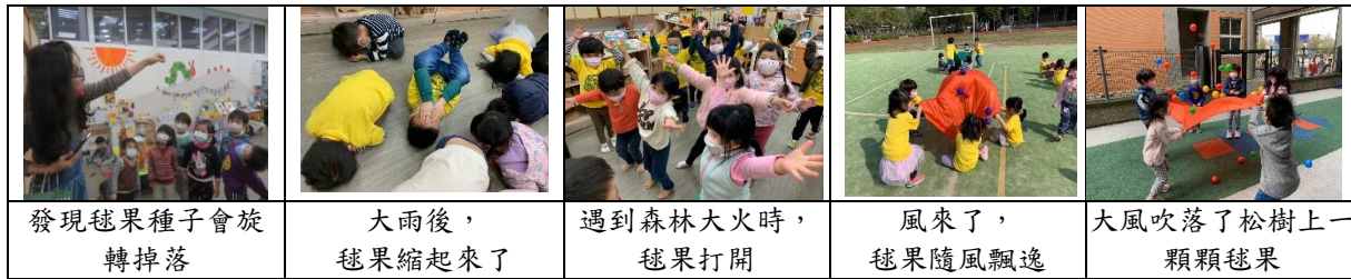
發現毬果種子會旋轉掉落