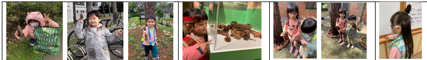
孩子們不約而同假日都到清大找到毬果

➤學習分享：透過家長回饋，了解孩子回家會主動分享在學校的學習狀況，幫助老師調整活動設計的內容與方法。(語-中-2-3-1)